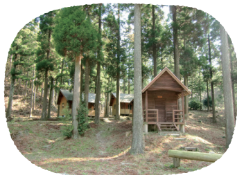
真名子木の香ランド

(真名子木の香ランド・瑞梅寺山の家・芥屋キャンプ場) 子ども連れで沢遊びやB.B.Q、ハイキング、海水浴などのアクティビティをしながら手軽にキャンプが楽しめます。テントやB.B.Qセットのレンタルも可能です。