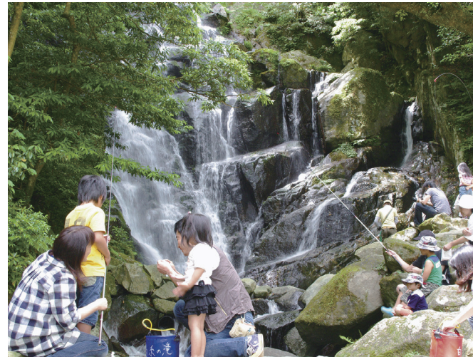
白糸の滝 ヤマメ釣りまつり

子どもの成長においては、集団遊びや自然とのふれあい、野外活動、社会体験などがたいへん重要です。豊かな自然に恵まれた系島市では、各種の公園、森のアドベンチャーパーク、海水浴場などを整備し、親子で安心して遊べる場づくりに取り組んでいます。