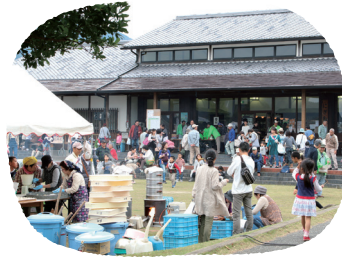
ファームパーク伊都国

多目的広場や遊具、ガーガーハウス(アイガモなどの飼育小屋)、ガラス温室などがあります。周囲の貸農園の申込み受付のほか、多種多様な体験イベントを行っており、親子連れで楽しめます。