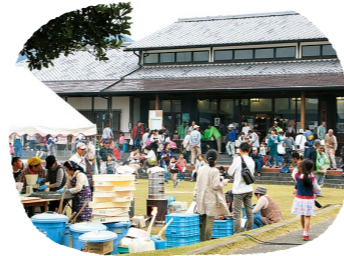
ファームパーク伊都国

多目的広場や遊具、ガーガーハウス(アイガモ等の飼育小屋)、ガラス温室があります。周囲の貸農園の申込み受付のほか、多種多様な体験イベントを行っており、親子連れで楽しめます。