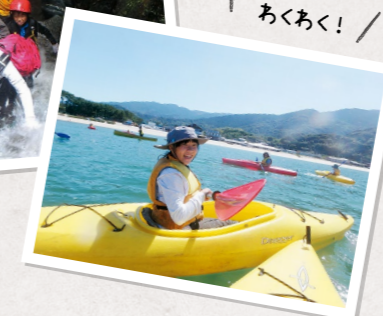
ドキドキ、あくあく!