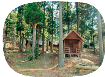
真名子木の香ランド

子ども連れで沢遊びやB.B.Q、ハイキング、海水浴などのアクティビティをしながら手軽にキャンプが楽しめます。テントやB.B.Qセットのレンタルも可能です。